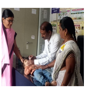
सदरील लसीकरण मोहिमेत

बोडके यांनी गावातील सर्व लाभार्थ्यांना लस देण्याचे नागरिकांना आवाहन केले.