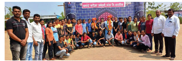
मात याबाबत कथन केले. तसेच आपल्या आई वडीलांनी आपल्याला दिलेली वेळ हा आपण खऱ्या अर्थाने समोर ठेवला तर आपले ध्येय निश्चित पुर्ण होते असे त्यांनी सांगितले. यावेळी मुले मोठ्या संख्येने उपस्थित होते.