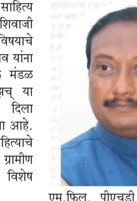
एम.फिल, पीएचडी चे मार्गदर्शक असून त्यांच्या मार्गदर्शनाखाली आठ विद्यार्थ्यांना एम.फिल.,आणि सात विद्यार्थ्यांनी पीएच.डी पदवी प्राप्त केली आहे.

जागतिकीकरणानंतर मराठी भाषेवर होत असलेल्या भाषिक व सांस्कृतिक आक्रमणाचा अभ्यास जागतिकीकरण, मराठी भाषा: आन्धाने आणि उपाय या ग्रंथातून त्यांनी केला आहे.या बरोबरच १९८० नंतरचे मराठी साहित्य स्वरूप आणि समीक्षा, १९९० नंतरचे ग्रामीण साहित्य स्वरूप आणि संदर्भ या ग्रंथांमधून ग्रामीण, दलित, स्त्री, आदिवासी व समकालीन साहित्याची समीक्षा केली आहे. तीस शोधनिबंध विविध नियतकालिकांमधून प्रकाशित आहेत. नांदेडच्या स्वामी रामानंद तीर्थ मराठवाडा विद्यापीठ मराठी अभ्यास मंडळावर ते तीन टर्म सदस्य होते.विद्यार्थी कल्याण मंडळ सल्लागार समिती सदस्य,बहि:शाल व्याख्यान माला सल्लागार समिती सदस्य म्हणून ही विद्यापीठ समित्यांवर काम केले आहे.