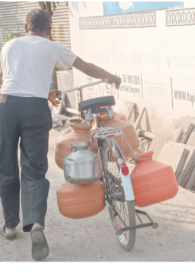
पांढरवाडी येथील लघु प्रकल्पातून काही शेतकऱ्यांकडून विद्युत मोटारीद्वारे पाणी उपसा सुरु आहे. हि बाब तहसिलदार, मंडळ अधिकारी तलाठी व पाट बंधाऱ्यांच्या अभियंत्याला फोनवर सांगूनही जाणीवपूर्वक दुर्लक्ष केल्याने तलावात केवळ ०५ % पाणी साठा शिल्लक आहे. तरी देखील काही शेतकरी पाणी उपसा करत आहेत. त्यामुळे येथे पाण्याची टंचाई भासत असून घोटभर पाण्यासाठी नागरिकांना वनवन भटकावे लागत आहे.