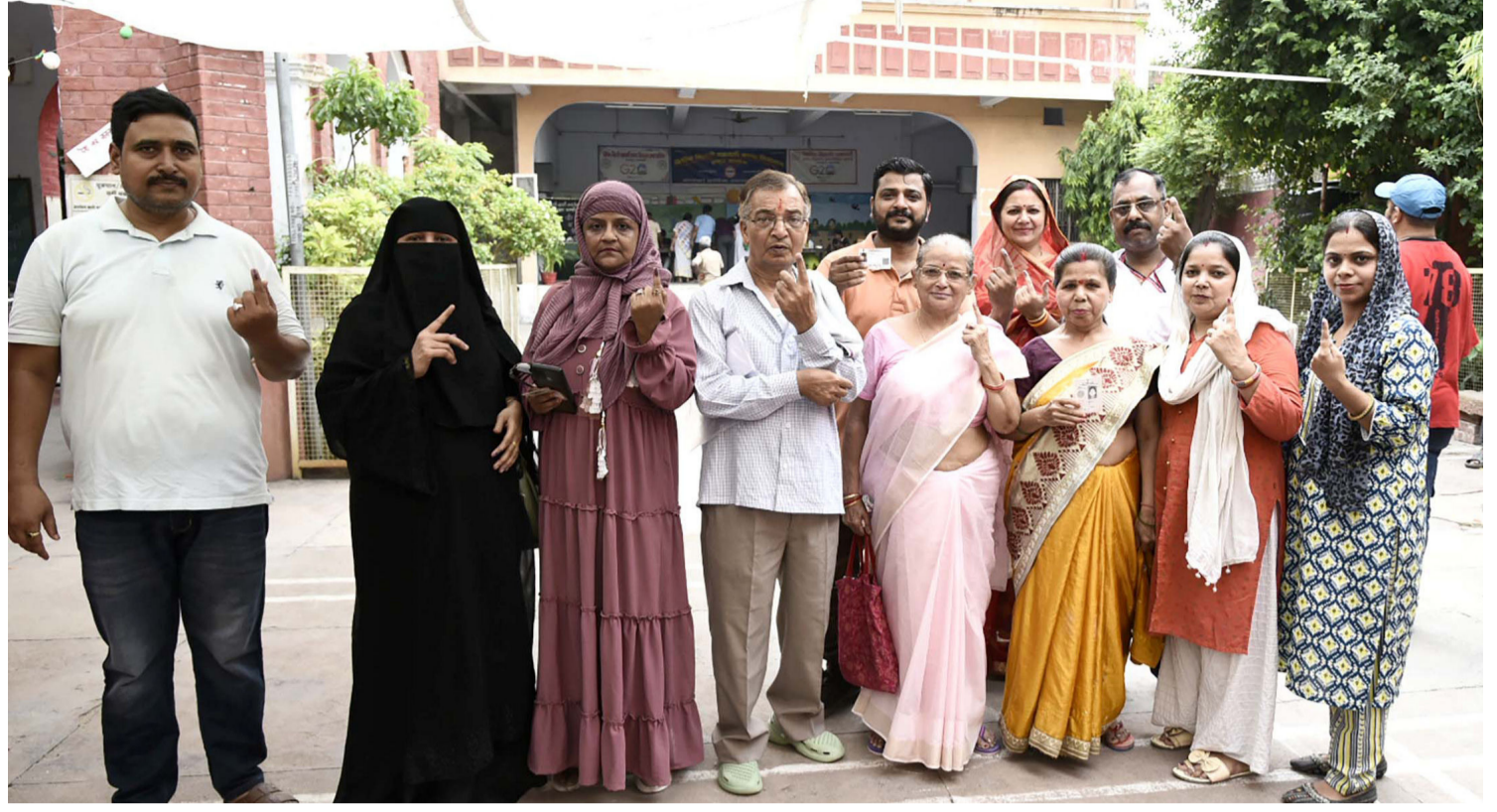
उत्तर प्रदेशातील चेतगंज येथील मतदान केंद्रावर मतदान केल्यानंतर अमित शाईचे चिन्ह दाखवताना मतदार.