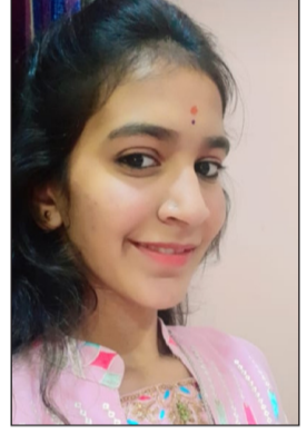
उदगीर (प्रतिनिधी) उदागिर येथील होकारना