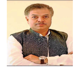
पाठपुरावा सुरु ठेवणार असल्याचे आ. पाटील यांनी सांगितले आहे.

होता. त्या समितीने दि. ११ जानेवारी २०२४ रोजीच्या बैठकीमध्ये या प्रस्तावास मंजूरी दिली होती. त्यानंतर उपस्थित त्रुटींची पूर्तता करत आवश्यक सर्व प्रक्रिया पूर्ण करून अंतिम मान्यतेसाठी हा प्रस्ताव शासनास सादर करण्यात आला आहे. शासनाची मंजूरी व निधीची तरतूद करून घेण्यासाठी