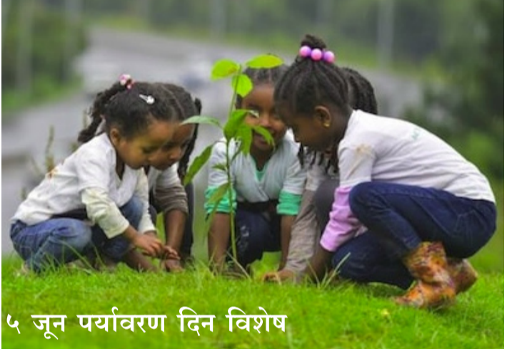
५ जून पर्यावरण दिन विशेष

फक्त माणूसच कारणीभूत आहे. प्रदूषणामागील कारणांचा ढोबळमानाने विचार करायचा तर सर्वात मोठी समस्या वाढती लोकसंख्या हीच आहे. मात्र आज कोणीही याचा गांभीर्यने विचार करत नाही. लोकसंख्या वाढली की शहरीकरण वाढते आणि शहरीकरण वाढले की गरजाही वाढतात. पुढे हीच बाब वाढते औद्योगिकीकरण, वाढती वाहनसंख्या आणि वाढते विकासप्रकल्प यांना चालना देते. आज आपल्याला विकास हवा आहे. तोदेखील अत्यंत वेगाने हवा आहे. मात्र या वृद्धपायीच आपण कमालीच्या वेगाने प्रदूषण वाढवले आहे. भारताबाबत बोलायचे तर लोकसंख्या अमर्याद वाढत आहे. आज जगाची लोकसंख्या ८१.१ कोटीच्या घरात पोहोचली असून त्यात दर वर्षी नऊ ते दहा कोटींची वाढ होत आहे. भारताची लोकसंख्या १४२ कोटींच्या पलीकडे गेली असून आपण जगात सर्वाधिक लोकसंख्या असणारा देश बनलो आहोत. मात्र नको त्या गोष्टीत आपण फार पुढे आहोत, याचा विचार कोणताही राजकीय पक्ष वा व्यक्ती करत नाही, ही दुःखाची बाब आहे. आधी उल्लेख केल्याप्रमाणे लोकसंख्या वाढली की गरजा वाढू लागतात. पण गरजा वाढतात त्या प्रमाणात नैसर्गिक स्रोत वाढत नाहीत. त्याने दिलेली प्रत्येक गोष्ट मर्यादित आहे. पूर्वी माणसाचे राहणीमान साधे होते. त्यातही खेड्यांमध्ये राहणाऱ्यांची संख्या जास्त होती. आता त्याच्या बरोबर उलट सुरू आहे. शहरीकरणाचा वेग वाढल्यामुळे आता शहरांची संख्या वाढली नसली तरी व्याप्ती वाढली आहे. परिणामस्वरूप