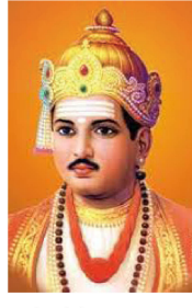
निर्णय घेणे बाबत बसवभक्त व हितचिंतक यांची बैठक रविवार