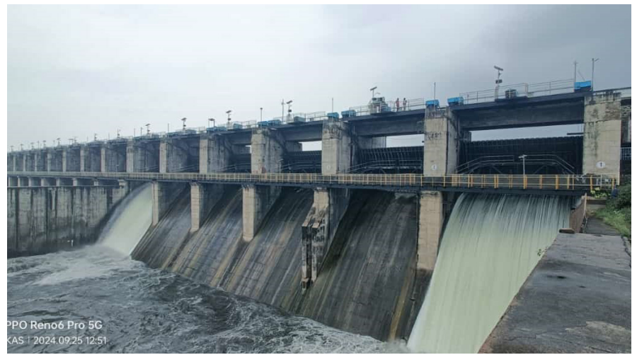
एकूण २२४.०९३ दलघमी पाणी साठवण क्षमता असलेल्या मांजरा धरणामध्ये सध्या जवळपास २१६ दलघमी पाणीसाठा आला असून धरण ९६ टक्के भरल्याने धरणामुळे बुधवारी दुपारी साडेबाराच्या सुमारास दोन वक्रद्वारे उघडून धरणामुळे मांजरा नदीत पाण्याचा विसर्ग सुरु केला आहे. मांजरा धरण भरल्याने लातूर बीड व धाराशिव जिल्ह्यातील काही शहरे व गावांना होणाऱ्या पाणीपुरवठ्याची चिंता मिटली आहे.

मुंबई : - मुंबईत सध्या मुसळधार पाऊस सुरु आहे. त्यामुळे वाहतुकीवर याचा परिणाम झाला आहे, मुंबईत सुरु असलेल्या पावसामुळे चाकरमान्यांची चांगलीच तारांबळ उडाली आहे. गेल्या १ तासापासून मुंबईत ढगांच्या कडकडाटासह मुसळधार पाऊस सुरु आहे. मुसळधार पावसामुळे दिल्ली - मुंबई विमान हे हैदराबादकडे वळवण्यात आले आहे. खराब हवामानामुळे विस्तार कंपनीच विमान हैदराबादला रवाना करण्यात आले. मुंबईत लॅंडिंग होऊ शकणार (पान ७ वर)